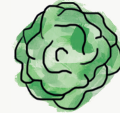
salade batavia ; laitue