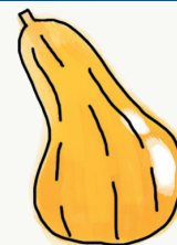
courge butternut ; muscade spaghetti