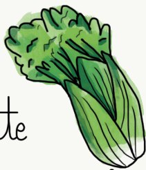
céleri rave ; branche