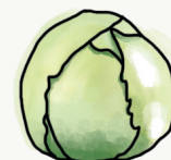
chou lisse rouge