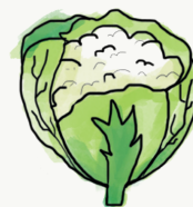
chou-fleur chinois ; frisé