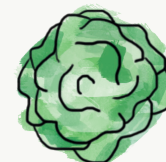
salade bataavia ; frisée ; laitue mâche ; scarole